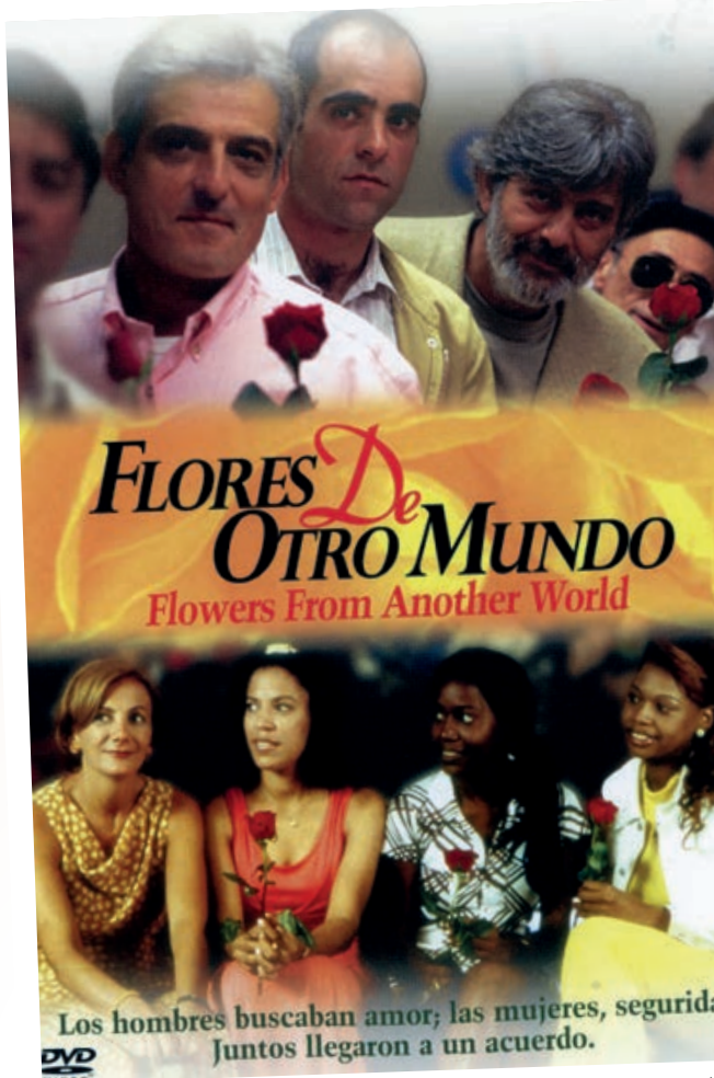
FLORES DE OTRO MUNDO (1999), de Icíar Bollaín. Una mirada sobre los problemas de género en la España vacía.