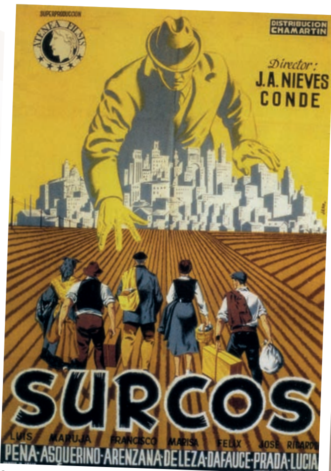
SURCOS (1951), de José Antonio Nieves Conde. El éxodo rural al Madrid depauperado de la posguerra en el inicio del "gran trauma".