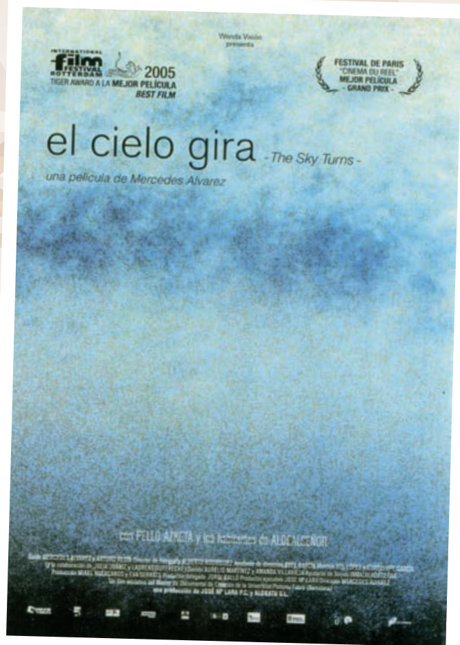
EL CIELO GIRA (2004), de Mercedes Álvarez. Una reflexión profundamente cinematográfica sobre la soledad de la España despoblada de los páramos de Soria.