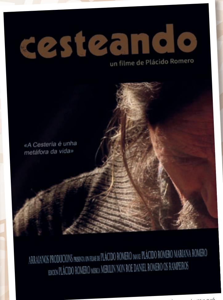
CESTEANDO (2016), de Plácido Romero. Una lúcida visión contemporánea sobre la desaparición de la identidad y cultura rural en Galicia.